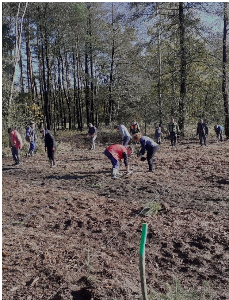
Zastupitelé a jejich rodinní příslušníci sázeli stromky.