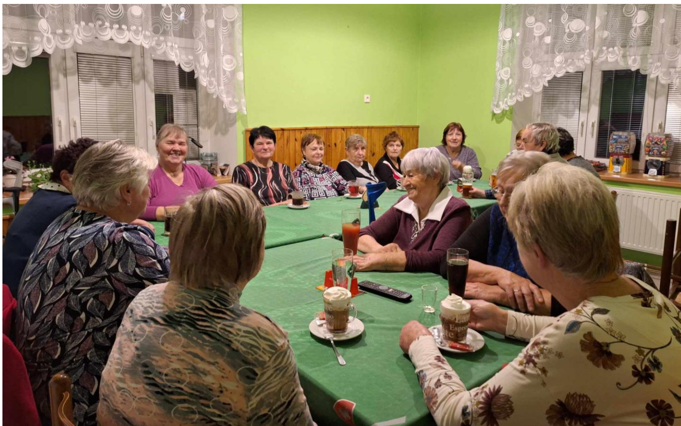
Setkávání při „Čaji o páté“ úspěšně pokračuje...